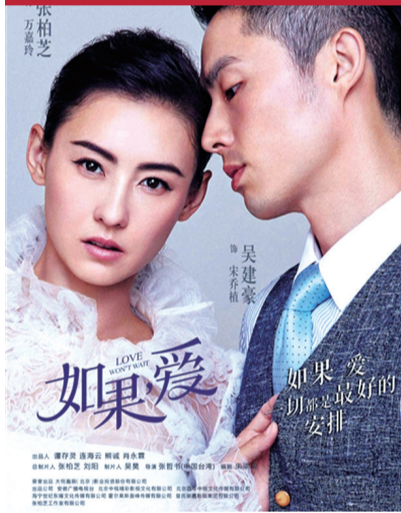
张柏芝担任总制片人的电视剧《如果,爱》