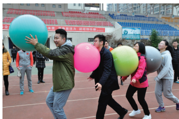
举办员工趣味运动会 提升凝聚力