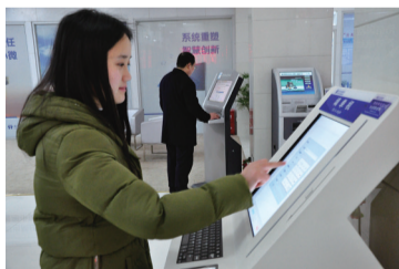
打造智慧网点 推进智慧银行建设