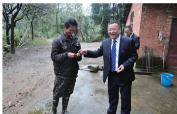
积极履行社会责任 走访贫困户

近三年来,截止3月底,存款规模稳步增长,各项存款余额47.2亿元、净增21.3亿元,增长76.3%,存款余额和净增额在全县金融机构均排名第一;贷款规模稳健扩大,各项贷款余额33.6亿元、增长15.3亿元,增长85.1%。贷款累放数和贷款余额占在全县金融机构均排名第一。