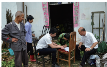
全力做好精准扶贫 上门发放扶贫贷款