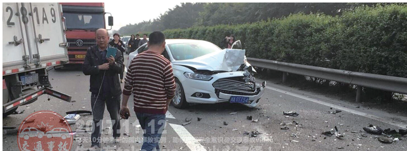
▲“交通事故 video”账号每天发布类似的各种车祸现场照片和视频

每天看10分钟最新国内车祸实例是怎样一种体验?微博上一个名叫“交通事故 video”的账号会告诉你这样的交通事故到底有多么残酷。账号每天都会发布时长为10分钟的国内车祸实例视频,助你提高安全意识。不仅如此,“交通事故 video”还有一句特别动人的宣传语:生命没有“take two”,请小心演绎。