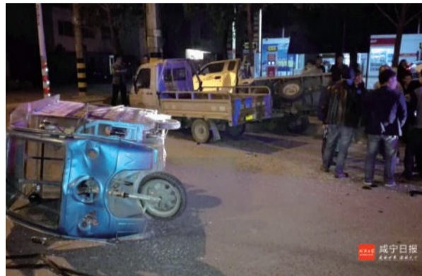
三轮电动车与两辆三轮摩托车相撞