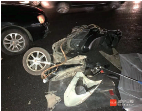
两轮电动车逆行与小车相撞