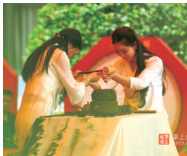
记者 陈婧 赵忠志

通过数场激烈角逐,制茶、茶艺两个项目的第一名被授予“咸宁市五一劳动奖章”称号,第一至第五名选手荣获“咸宁市技术能手”称号,并颁发相应技术等级证书。荣获“咸宁茶匠能人”的10名获胜者,被授予“咸宁市五一劳动奖章”。