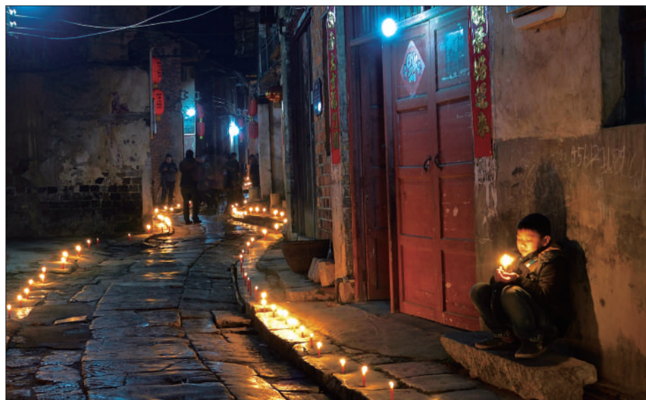
■摄影《石板街的夜》潘纪东