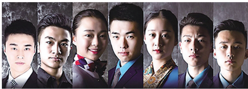
同学们的职业“剧照”

随着电视剧《人民的名义》的热播，在一些高校的校园里，也刮起了一阵创意模仿剧照的风潮：昨日，记者在朋友圈看到，重庆海联职业学院的同学们就拍了一组职业“剧照”，以学子的名义诉说他们的航空梦，瞬间圈粉无数。