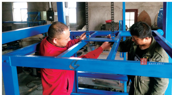
自造的水泥砖码垛机