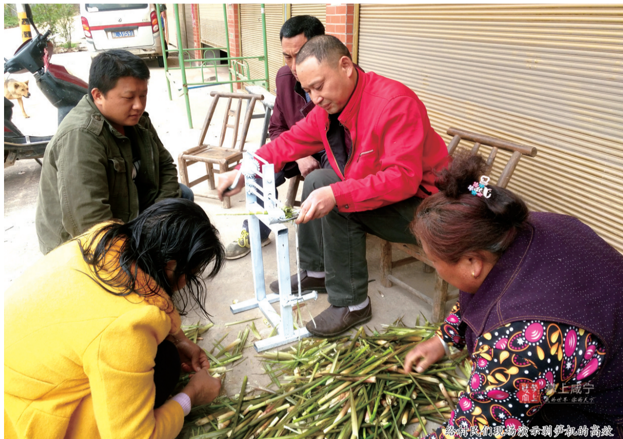
给村民们现场演示剥笋机的高效

通山一农民两天造出能顶3个人干活的“剥笋机”，七天造出能顶2个人干活的“码垛机”