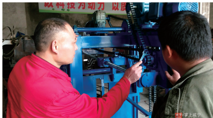
独自制造的水泥砖送板机