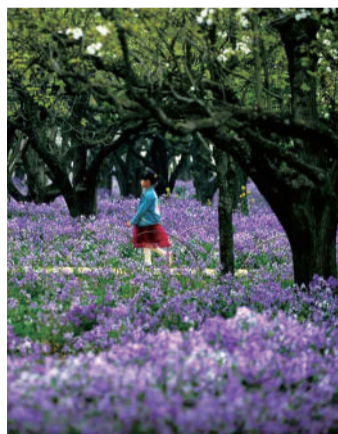
■摄影《花海畅游》王慧