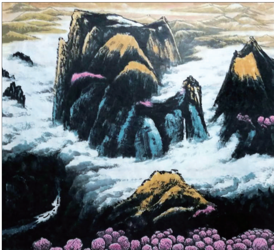
■国画《春回山巅》陈金鹏