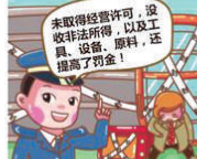
未取得经营许可证,没收违法所得,以及工具、设备、原料,还提高了罚金!

在这里特别提醒大家,新修订的《食品安全法》中,对未获得许可从事食品生产经营的处罚力度比旧版提高了数倍!除了法律责任中保留没收违法所得,违法生产经营的产品、工具、设备、原料等物品之外,罚款金额大幅提高。