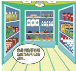
食品销售要有相应的场所和设备设施。

食品销售者不生产食品,但绝对不是食品的搬运工这么简单。食品销售属于食品经营,国家对于食品销售行为的安全要求十分严格。在开展食品销售之前,必须依法取得相关许可。一般来说,食品销售者想要获得食品经营许可证,需要有与其经营的食品品种、数量相适应的场所和设备设施,还需要有食品安全专业技术人员、食品安全管理人员和保证食品安全的规章制度。