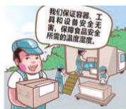
我们保证密封、工具和设置安全无害,保障食品安全所需的温度、湿度。

假如不是从事食品生产经营,只从事食品贮存、运输和装卸的,则需要保证贮存、运输和装卸食品的容器、工具和设备安全、无害;并保障食品安全所需的温度、湿度等特殊要求。