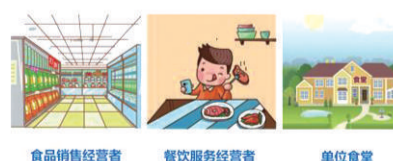
食品销售经营者 餐饮服务经营者 单位食堂

食品药品监管部门按照食品的风险程度对食品生产经营实施分类许可,食品经营主体业态分为食品销售经营者等10个类别。