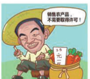
销售农产品,不需要取得许可!

在这里特别提醒大家,新修订的《食品安全法》中,对未获得许可从事食品生产经营的处罚力度比旧版提高了数倍!除了法律责任中保留没收违法所得,违法生产经营的产品、工具、设备、原料等物品之外,罚款金额大幅提高。