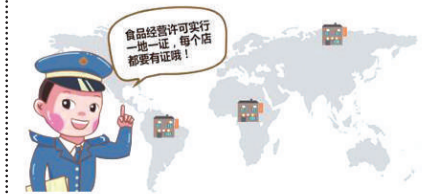
食品经营许可证可实行一地一证,每个店都要有证哦!

根据8月31日国家食品药品监管总局公布的《食品经营许可管理办法》,将食品流通许可与餐饮服务许可两个许可整合为食品经营许可证。食品经营许可证可实行一地一证原则,即食品经营者在一个经营场所从事食品经营活动,应当取得一个食品经营许可证。