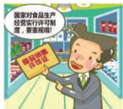
国家对食品生产经营实行许可制度,一方面是审核食品生产经营者是否具备资质,另一方面也是方便日后监管。而在实际的食品销售中监管部门发现,不少食品销售者对需要获得许可这一点不够重视。

满足了以上条件,食品销售者便可以到县级以上地方人民政府食品药品监督管理部门申请办理许可了。有一种例外情况——如果只是销售食用农产品,不需要取得许可。