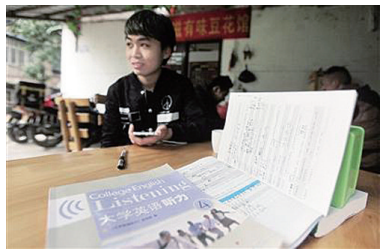
毛召木的英语书和笔记。

“不懂英语,你可能连外卖都领不了。”3月14日,有网友在微博爆料称,四川外国语大学一外卖送餐小哥用英文发信息告知他领取外卖。这条微博引来不少热议,有网友感叹:在