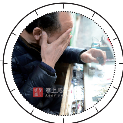
每过 十几分钟 就要停下 来揉下眼 睛