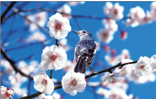
■摄影《雀上梅枝》李海波