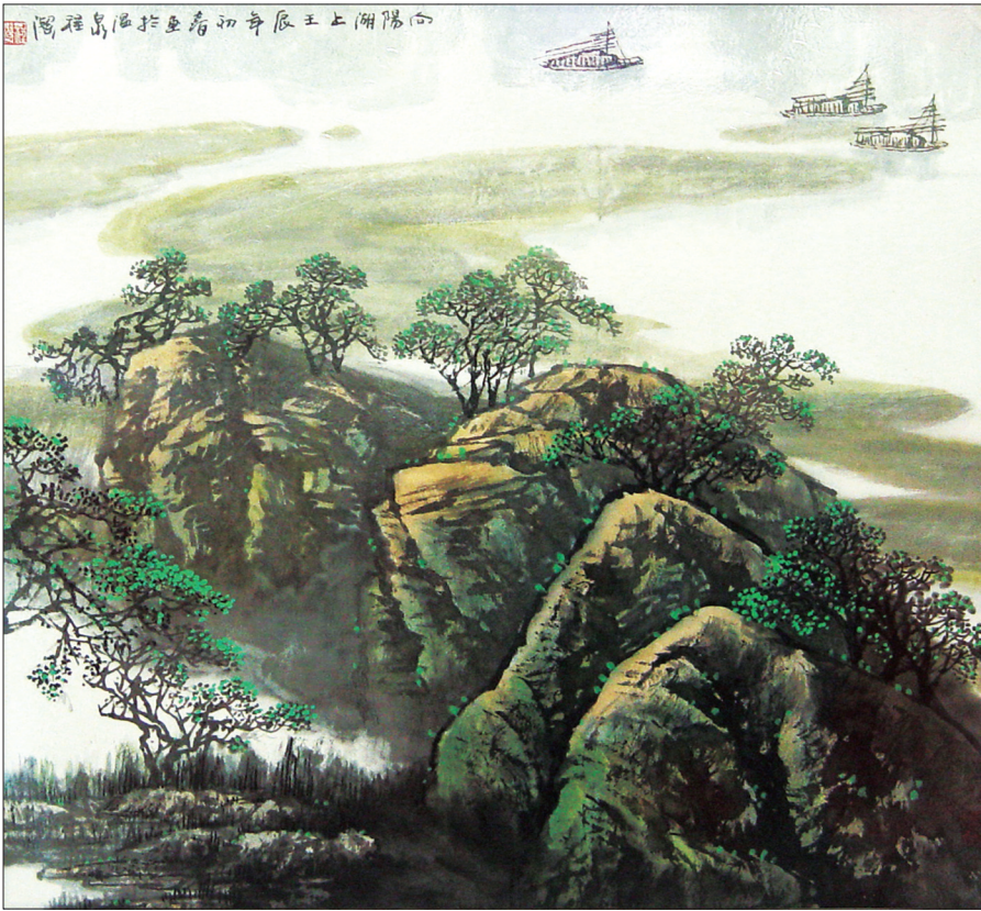
■国画《洒满大地》程洁

优雅且从容地笑对往昔 韵律如同缓慢下来的时光 愈来愈享受这平淡的生活 ——温暖，舒适，安静 明媚的山水展开抒情的画卷 闻鸡起舞，成为我们新年的寄语 悟出一份真谛，从此让生命充满意义