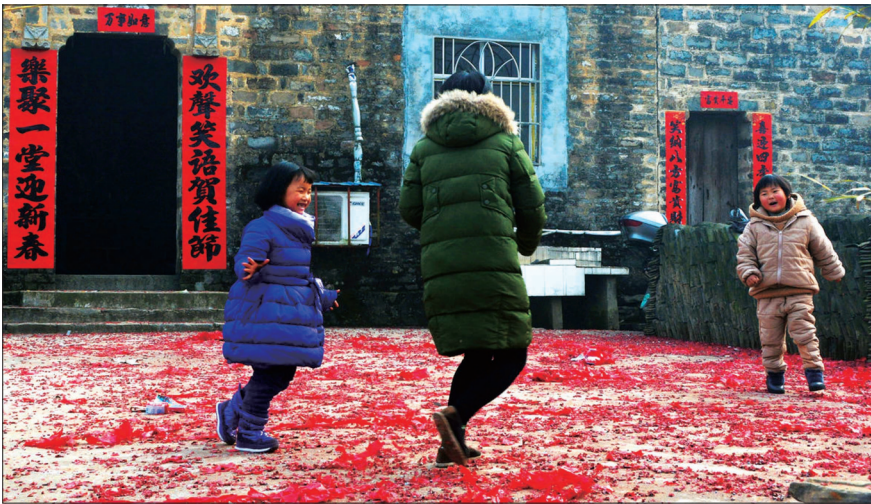
■摄影《欢乐新年》方华