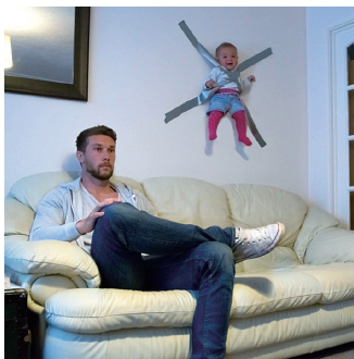
孩子：你们这样会失去本宝宝的。