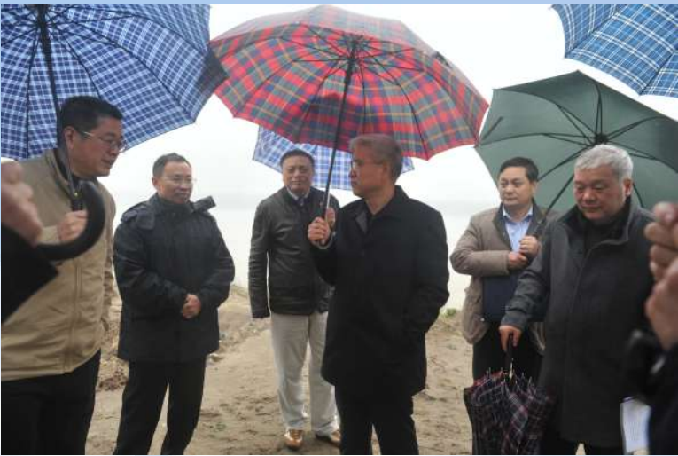
12月12日,湖北省交通运输厅厅长何光中一行,对咸宁市长江干线非法码头治理和船舶水污染防治工作进行实地调研。对我市长江干线非法码头治理工作成绩给予充分肯定和赞扬。

取缔行动开展以来,市领导和各相关单位负责人深入码头现场检查督办治理工作32次,共发现督办问题63项,嘉鱼县和赤壁市两地政府作为治理工作责任主体,对取缔工作给予了人力、物力、财力上的大力支持。嘉鱼县政府部门召开专题会议,