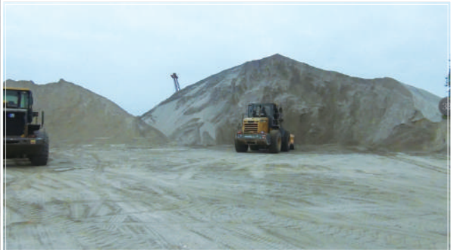
东港砂石码头取缔前