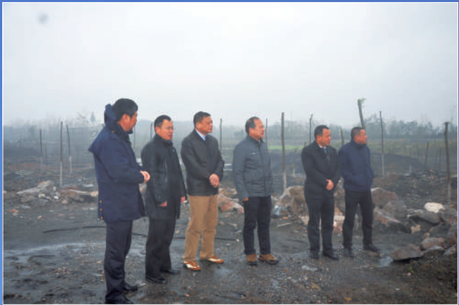
11月23日,湖北省港航海事局局长王阳红调研非法码头治理及陆水河航道整治工作。

因此,下一步,咸宁市港航海事局将加快推进规范和提升类非法码头治理工作。按照《咸宁市长江干线码头规范提升实施方案》“一码头一方案”对全市11处规范提升码头(嘉鱼10处、赤壁1处)拟定规范提升方案,所制定方案取得市联席办批复后立即开始实施,在时间节点内达不到规范提升要求的码头则予以取缔。此外,还将大力推动砂石集并中心的规范提升建设。真正实现绿色发展,建设生态长江。