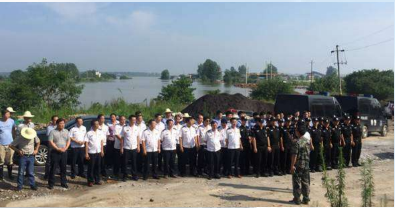
7月8日,嘉鱼县人民政府组织公安、水务、交通等多部门100余名执法人员在东港码头开展联合执法行动。

12月的长江赤壁港区,江风阵阵,水雾蒙蒙。曾经的赤壁市源和码头所在地一片寂静,数百棵刚刚栽种的树苗整齐划一,地面上翻新的黄土显示出被平整的痕迹。咸宁市港航海事局的工作人员指着一个通往江边的斜坡说:“这里原来装着‘飞机跳’,可以把货物运到船上。这一大片空地和树林以前就是堆场,堆放着大量沙石。”几个月前,这还是赤壁最大的一个“黑码头”,常年尘土飞扬,车来船往。全市治理非法码头的工作开展以来,这里终于恢复了宁静。