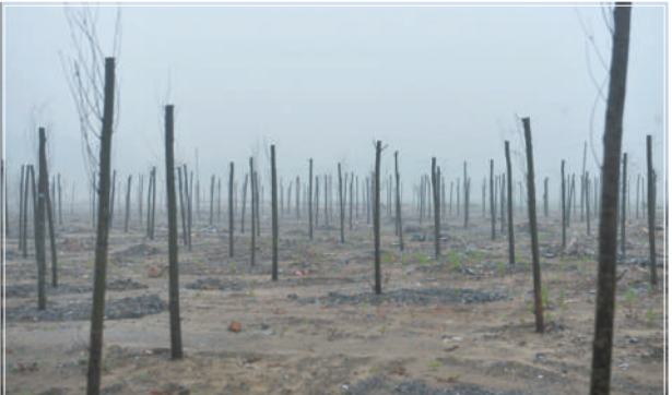
东港砂石码头取缔后进行覆绿