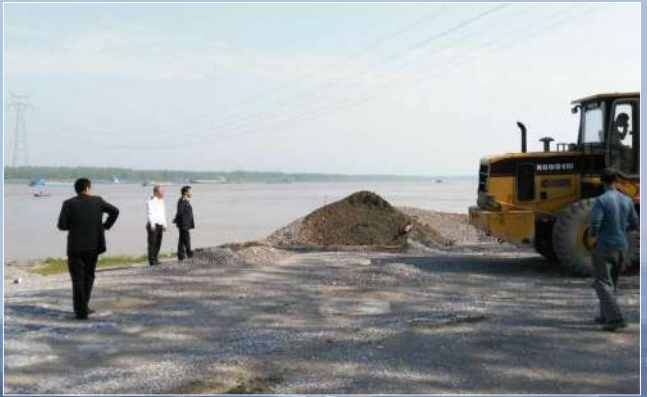
工作人员清理、平整原非法码头堆场