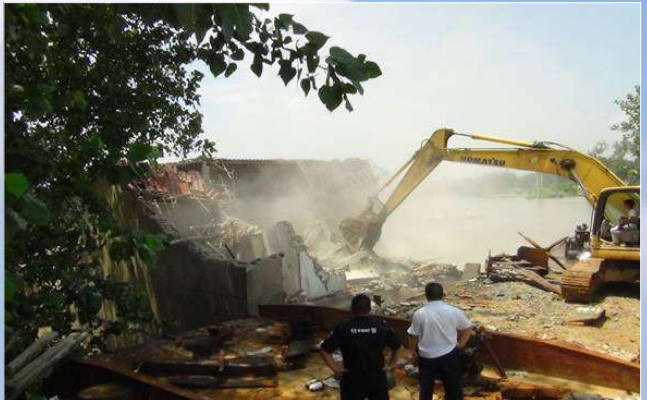
大型挖掘机对非法码头上的违法建筑物进行彻底拆除和清理