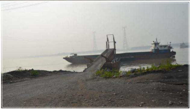
取缔前源和公司飞机跳1号泊位