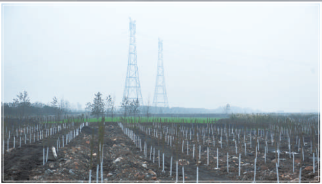
源和码头取缔后进行覆绿