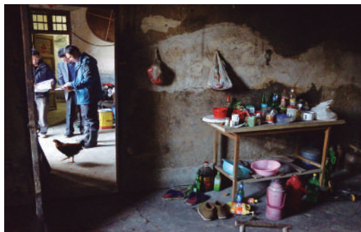
市驻村工作队在夏基亮家入户调查核实。