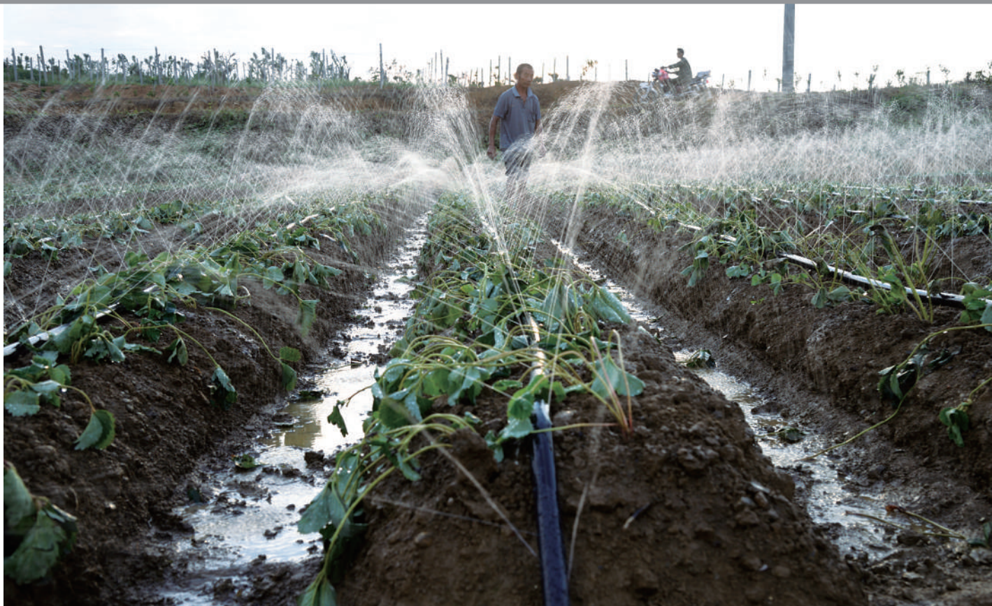
当地农民在富民公司蓝莓园打工。