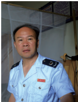
纪实摄影师张桂林