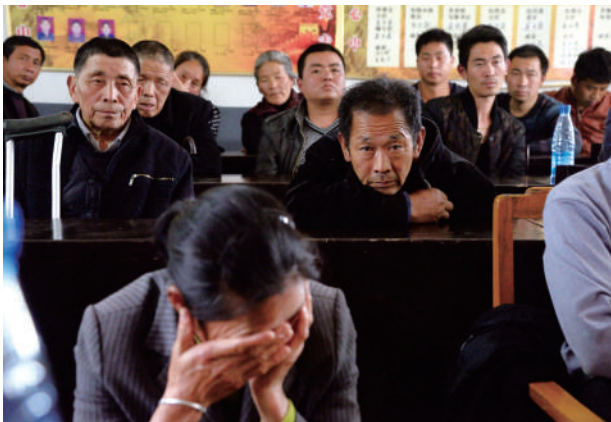
织着无奈、困乏与渴望。在村贫困户大会上,贫困户的脸上交