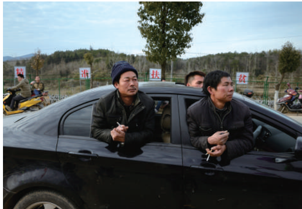
会,吸引路过的老百姓停车驻足观看。新桥冯村召开村民脱贫致富动员大会