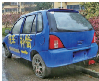
@俺山凹里人:帮谁补胎?