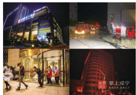
华信大酒店夜间实战拉动演练

为确保旅游节期间执勤保卫落实到位,10月13日晚,市消防支队在华信大酒店成功举办跨区域拉动演练。整个演练过程启动人员密集场所灭火救援应急预案,先后调派温泉三号桥执勤点、特勤中队和咸安中队共18辆消防车、71名消防官兵前往扑救,支队全勤指挥部、温泉大队全勤指挥部遂行作战指挥。温泉消防大队将进一步加强实战化演练,着重对毗邻建筑、周边道路、市政水源、内部