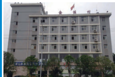
雄伟气派的办公大楼