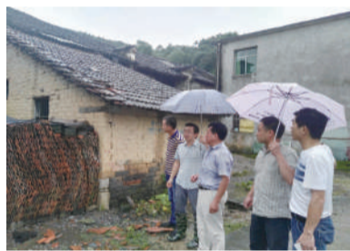
处村领导查看危房