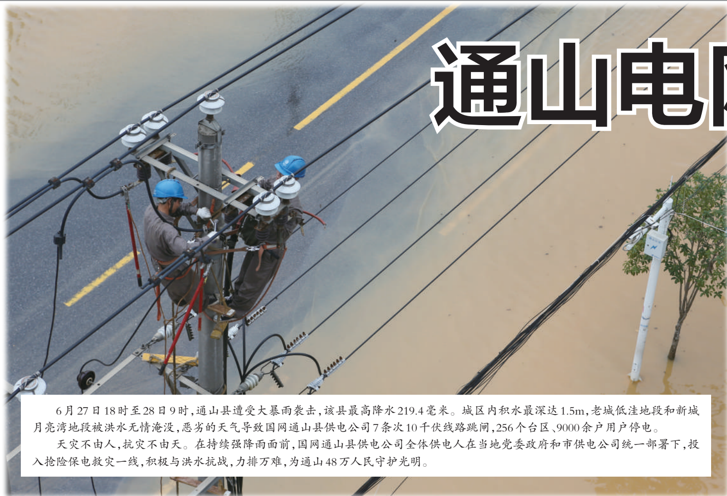
6月27日18时至28日9时,通山县遭受大暴雨袭击,该县最高降水219.4毫米。城区内积水最深达1.5m,老城低洼地段和新城月亮湾地段被洪水无情淹没,恶劣的天气导致国网通山县供电公司7条次10千伏线路跳闸,256个台区、9000余户用户停电。天灾不由人,抗灾不由天。在持续强降雨面前,国网通山县供电公司全体供电人在当地党委政府和市供电公司统一部署下,投入抢险保电救灾一线,积极与洪水抗战,力排万难,为通山48万人民守护光明。