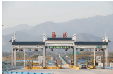
杭瑞高速公路通城段