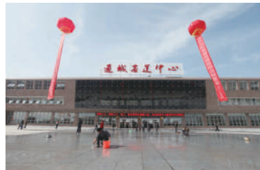
新建的县客运中心