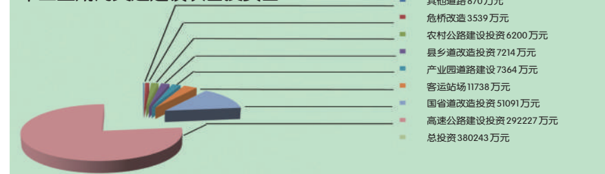
十二五期内交通建设项目投资图