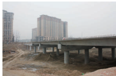
建设中的106国道绕城公路柳峦大桥