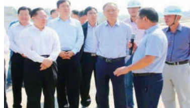
省市县领导指导交通建设工作