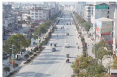
改造升级后的106国道隽水段