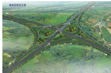
杭瑞高速与武深高速交汇互通