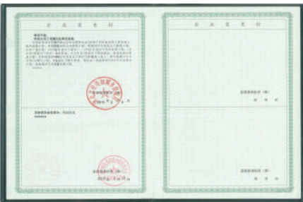
市政公用工程施工总承包贰级资质