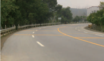
△路面整洁、设施完善的107国道