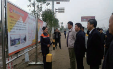
△交通部检查组领导在西河大桥现场检查

同心协力齐上阵,众志成城闯雄关。今年该局厉兵秣马,严格对照国检标准,认真贯彻落实上级部署,强力推进各项工作,取得了良好成绩,在“十二五”收官之年交上了一份圆满答卷。