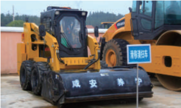
△设备齐全的应急机械库