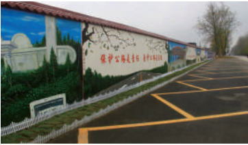
△公路观景平台、停车港湾