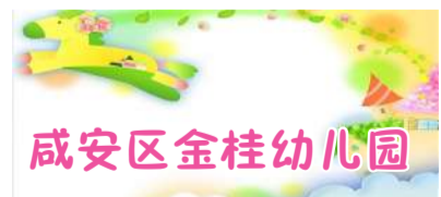
咸安区金桂幼儿园

本次活动的开展,既锻炼了幼儿的体质,培养了良好的参与意识、竞争意识和合作意识,让幼儿体验到了游戏活动所带来的乐趣,又增强了幼儿和家长的沟通与交流,达到了家园共育的目的。(记者 夏咸芳)