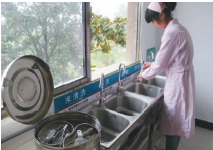
干净整洁的清洗室