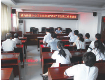
“创四化”工作推进会

如今,走在住院部的病区里,一眼便能看到位于病区中心的护士站。作为第一时间、全方位了解患者病情动态变化的“前哨”,这里也随着标准化建设的推进焕然一新。准备间、治疗间、消毒间、医疗废物处置间,每一间背后都凝聚着高水平、高质量的医疗服务;24小时开水供应、空调、卫生间、多功能病床、床头呼叫系统、直饮水、热水器,这些现代化的设备设施,再也不是只在大医院才能见到的了,在家门口的医院,横沟桥镇的老百姓们一样可以拥有温馨、舒适的就诊空间。“你轻声呼唤,我立刻出现”,以人为本的服务理念正成长在横沟桥镇中心卫生院的每一个病区。