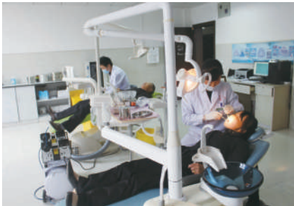
设备齐全的口腔科

信息共享平台录入上报工作规范有序,基本公共卫生服务信息系统报送工作流程规范,村卫生室全部配齐电脑,及时沟通对接,院村一体化管理模式有序运行。建设标准化、业务规范化、管理科学化、运行信息化,“四化合一”,给患者带来的是实惠,给医院带来的是发展。风正时济自当破浪扬帆,任重道远更需砥砺前行。我们坚信,横沟桥镇中心卫生院全体医护人员将以更加昂扬的精神风貌,再展新风采,再创新特色,再铸新业绩!