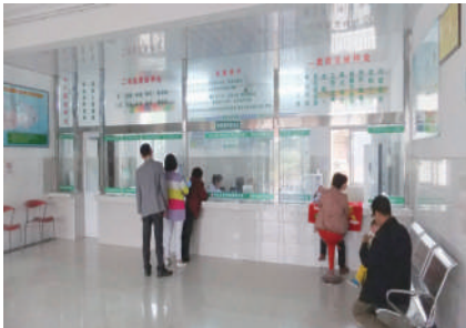
公共卫生科接待大厅