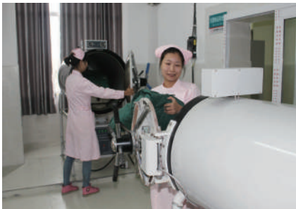
运行规范的消毒供应室