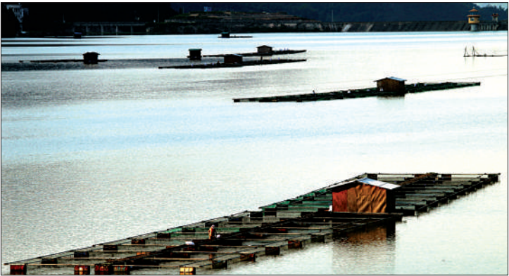
■ 摄影《红荷之恋》苗青摄