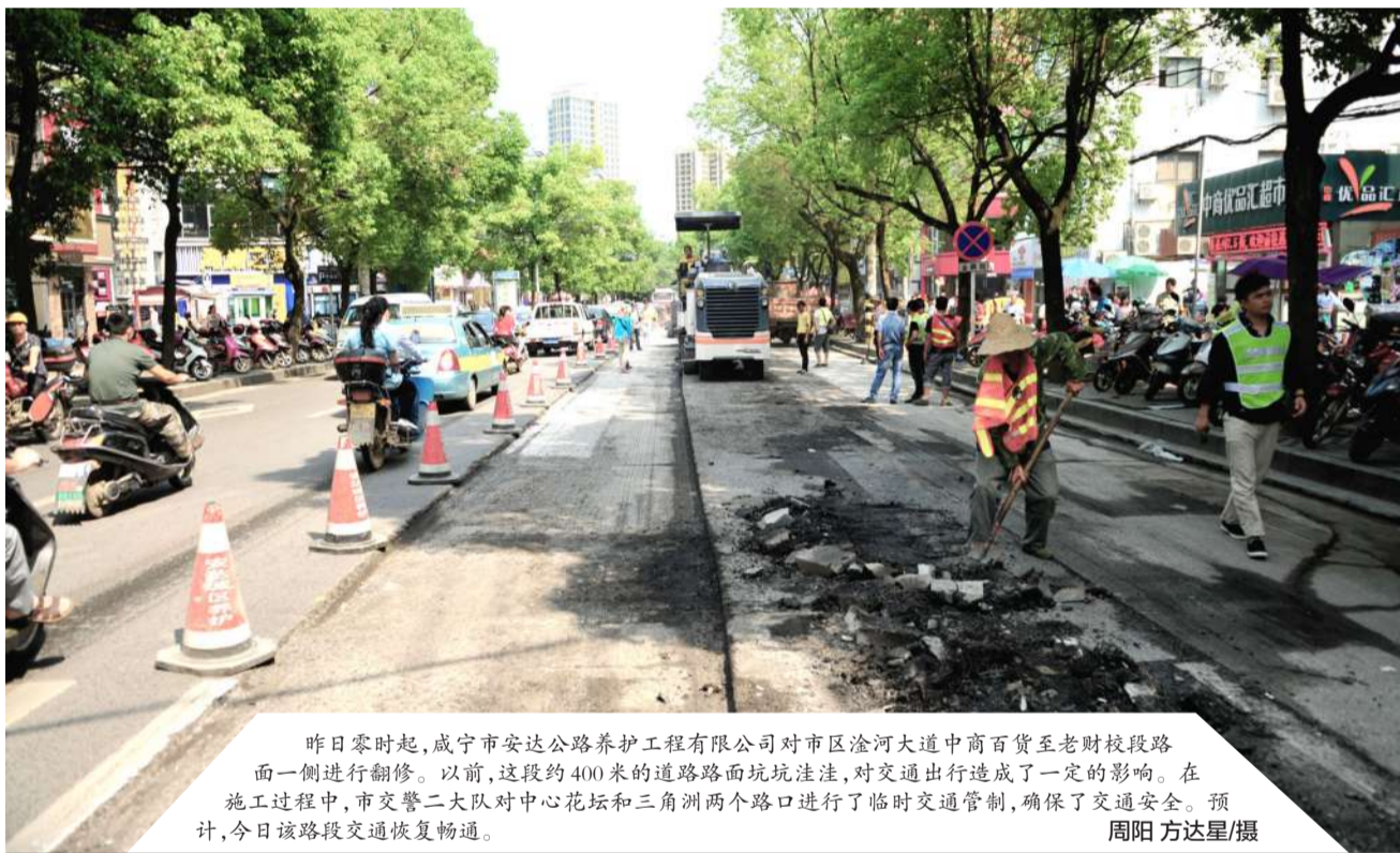
昨日零时起,咸宁市安达公路养护工程有限公司对市区淦河大道中商百货至老财校路段 面一侧进行翻修。以前,这段约400米的道路路面坑坑洼洼,对交通出行造成了一定的影响。在 施工过程中,市交警二大队对中心花坛和三角洲两个路口进行了临时交通管制,确保了交通安全。预 计,今日该路段交通恢复畅通。