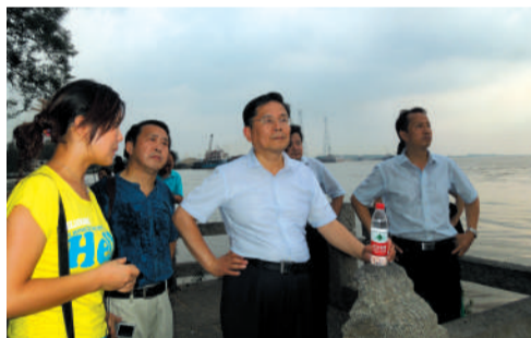
汪国真在三国赤壁古战场

汪国真还寄语咸宁:“咸宁山水秀美,香城历史悠久,泉都风俗迷人,无论从哪一方面来说,都值得让人来一次。希望咸宁人民能珍惜今天的生活,爱护自己的环境,发扬自己的文化,让香城香飘四海,走向美好未来。”