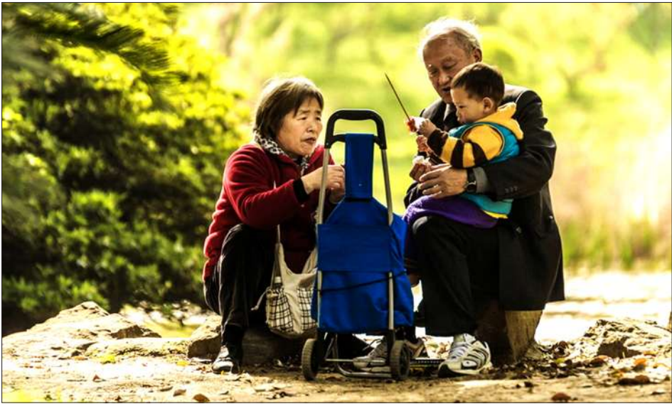
■摄影《含饴弄孙》苗青

我听见一声叹息 随茶叶缓沉杯底 清凉的爽意 轻轻浮上唇来 茶就是我前生的知己了 一生中上上下下 难得如此静坐如禅 守住这杯茶 也就守住了面孔和身影 守住了白云蓝天