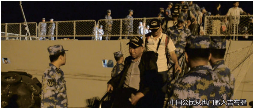
中国公民从也门撤入吉布提

沙特阿拉伯领头的“果断风暴”空袭行动28日夜至29日晨进入第四夜,摧毁了首都萨那国际机场的跑道,机场瘫痪。数小时前,超过200名联合国和外国政府、国际机