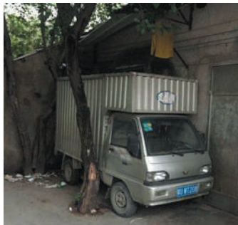
@生活日报:高手在民间。