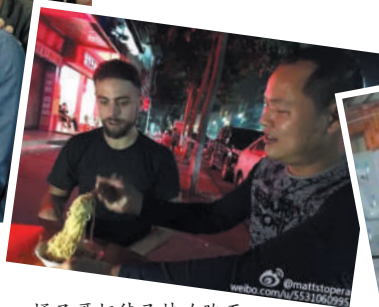
橘子哥招待马特吃腌面