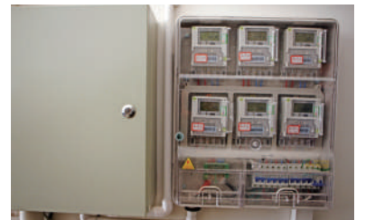
改造后标准的接户线。