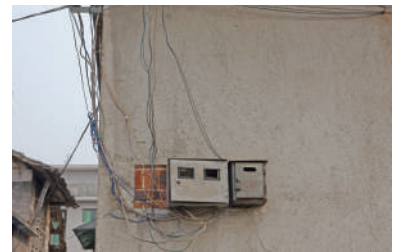
待改造的接户线。

崇阳县供电公司副总经理郑福时介绍,崇阳县和咸安区是我省接户线改造工程试点县市区。为了把这项惠民工程实施好,崇阳县供电公司春节前就做好了各项准备。列入改造计划的配电台区,绝大多数是偏远山区,其中包括高椅老虎洞、青山这样的苏区、库区。这些地方接户线老化严重,用电问