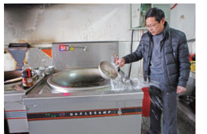
南门小学电气化厨房中的电炒锅。

目前,通城县供电公司已与各乡镇达成协议,将15所农村中小学纳入第二阶段电能替代项目。不久的将来,全县中小学都将用上清洁的电能。