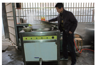
南门小学电气化厨房中的多功能液态导热锅。