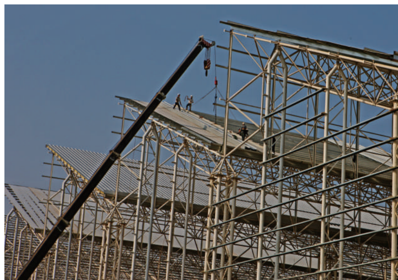
在建的咸宁祥天自然能发电空气储能厂房一角。

记者期待,有咸宁供电人的用心服务,祥天的科技种子将在鄂南大地早日开花结果;有空气能这样的新能源,咸宁的天空将更加湛蓝。