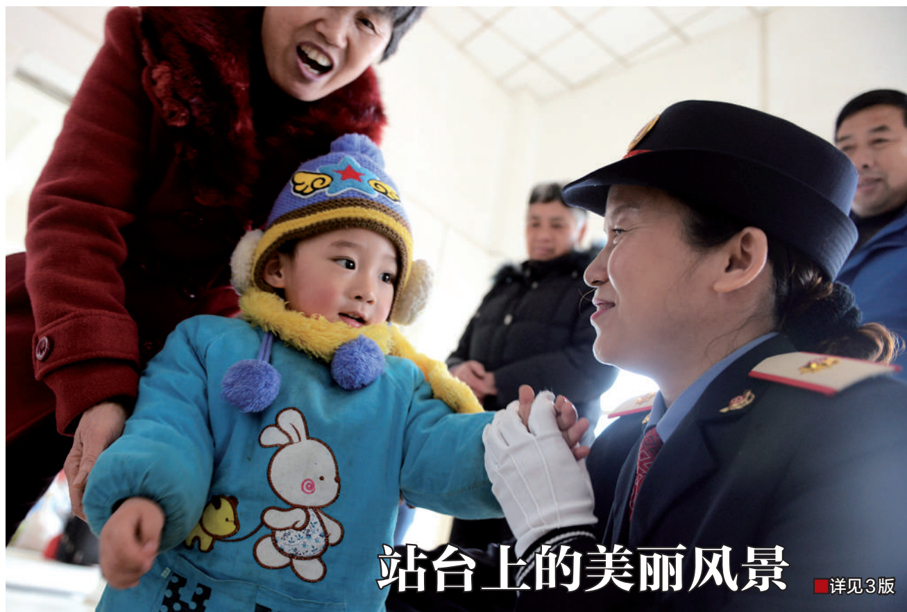
站台上的美丽风景