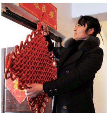
挂上火红的中国结