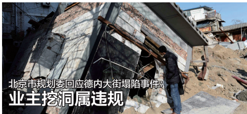
北京市规划委回应德内大街塌陷事件：业主挖洞属违规

最高检反贪污贿赂总局局长徐进辉此前介绍，检察机关在魏鹏远家中搜查发现现金折合人民币2亿余元，成为建国以来检察机关一次查获赃款现金额最大的案件。