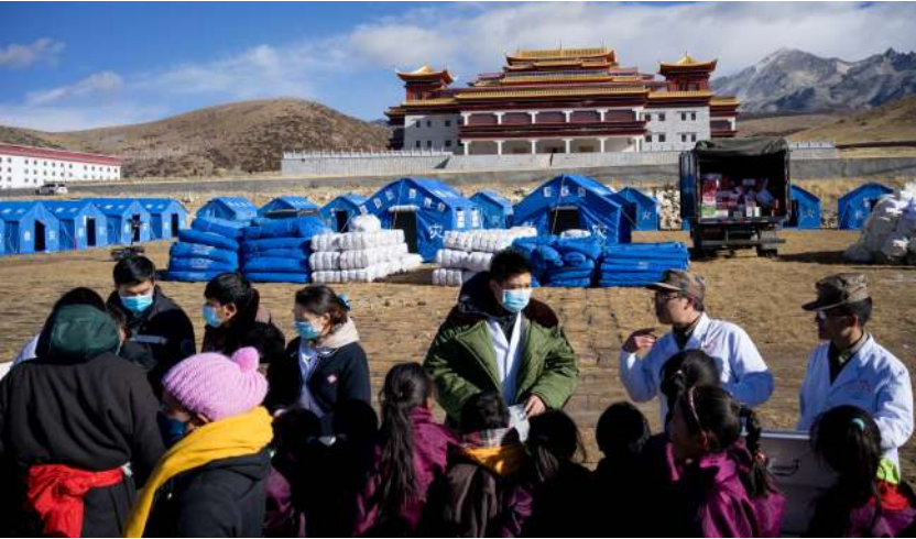
康定县木雅祖庆学校无学生遇难,师生得到妥善安置。

根据习近平指示,四川省紧急启动Ⅱ级地震应急响应,省救灾工作组赶赴灾区指挥抗震救灾工作。武警、公安、消防正在组织力量对中断的省道211线开展抢通工作。民政部、交通运输部、卫生计生委等部门已启动应急机制,指导当地有关部门全力做好抗震救灾工作,并向灾区紧急调运棉被、帐篷等救灾物资。中国地震局也启动Ⅱ级应急响应,派出现场工作组赶赴灾区。