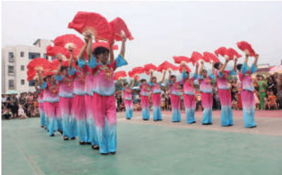
▲文化惠民 丰富多彩

已投入资金130余万元,完成村组断头路5处8.5公里;投入10万余元,完成塘堰维修8口;投入50余万元,完善村级“五务”活动场所3个;结对帮扶困难群众60人,帮扶资金达1.8万元。