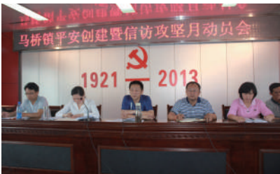
▲开会动员 部署工作

针对“亦石路至钱庄村公路狭窄,群众出行不便和排水、积水及屠宰场污水”等问题,该镇主要领导及时前往实地察看,并制定了整修方案,于9月份开工维修建设。并启动了旧城改造,解决集贸市场、停车场、老政府房屋等急需维修建设问题。同时,该镇