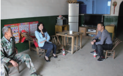
▲进村入户 广征意见