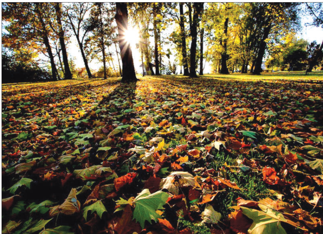
■摄影《落叶情深》吴海明

青色的湖我爱你 爱你的美丽 爱你的神奇 爱你的富有 爱你的长青本色 爱你到天荒地老