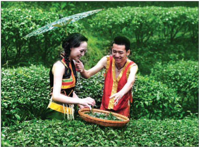
摄影《茶香与爱情》黄家双