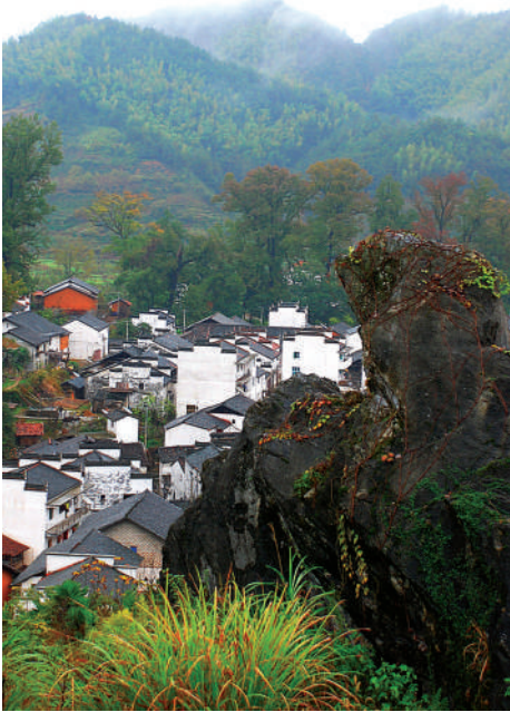
摄影《山里人家》方华

牧鸭少年望着水面游动的群鸭 眼前幻现出一幅梦想中的图画 驾着自己设计的远洋巨轮 顷刻间便跑遍了四海天涯