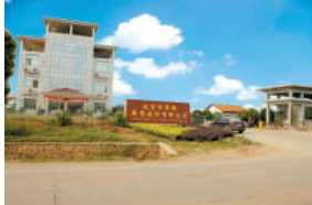
咸宁市华桥新型建材有限公司