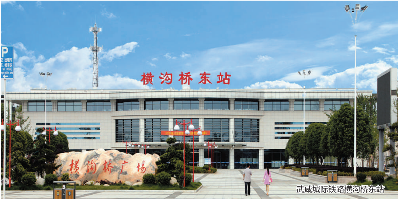
武咸城际铁路横沟桥东站