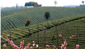
横沟桥镇有机茶基地

农用垃圾车和1台垃圾装载机,并向区“三万”办申请垃圾清运车5辆,向区环保部门申请勾臂车3辆;三是配套垃圾压缩装备,投入50万元,率先在全区建成日处理20吨垃圾的垃圾液压中转站,所有垃圾在压缩站集中压缩处理,统一运送至市垃圾焚烧发电厂;四是配备街道洒水清洗装备,投入15万元新添1台10吨的洒水车,每天进行路面洒水,保持路面清洁,整体提高街道路面清洁度。 该镇首创工商业资本“下乡进村”,呈现品牌农业型、特色农业型、休闲旅游型、家庭农场型四大经营模式。全镇共有26家工商业资本先后对该镇进行农业投资开发,投资总额达4.5亿元,已流转面积4000余亩。