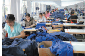
咸宁嘉源制衣车间