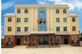
横沟桥镇袁铺村党员群众服务中心