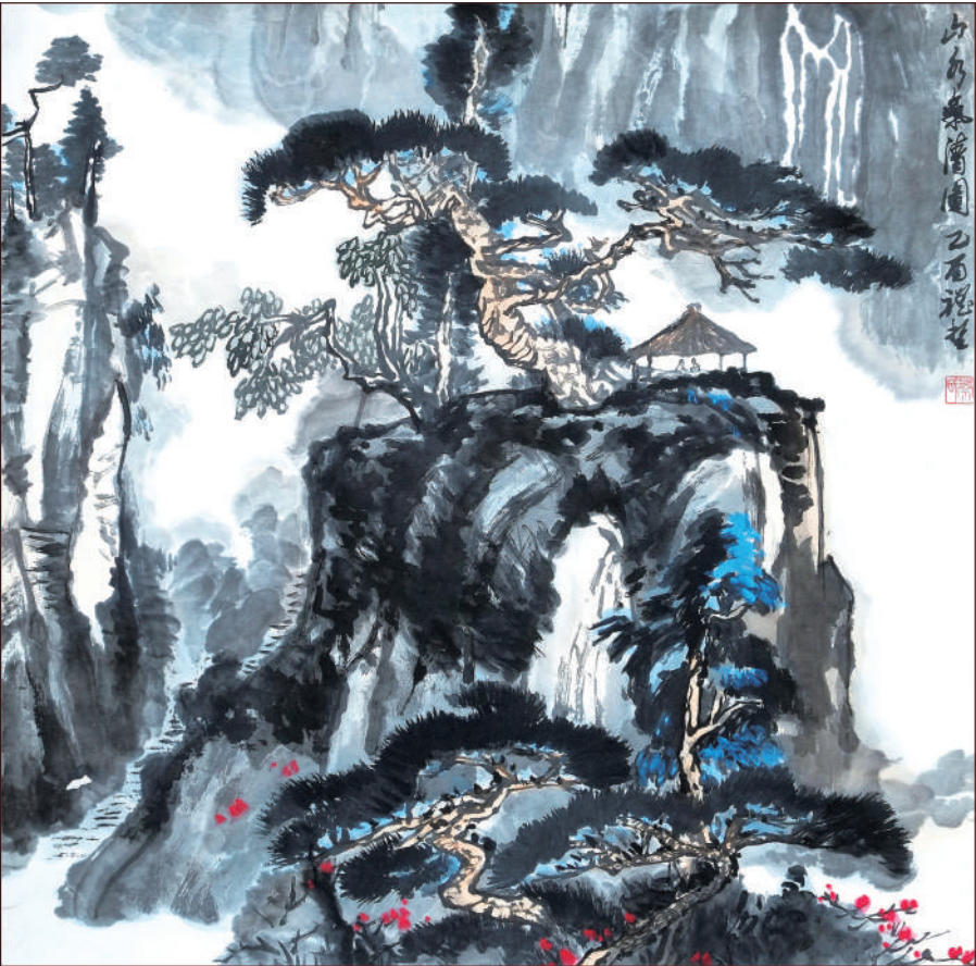
国画《山高气清图》蔡礼哲