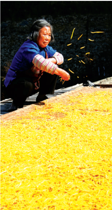
摄影《收获的季节》李海波

温婉的月一经盛开 如水的清辉便突袭而至 我惊讶地看见 树梢上 挂着双亲泪水涟涟的凝望 那目光把我深深地烙伤