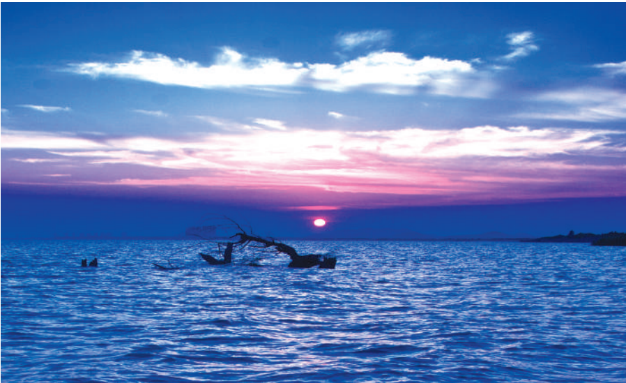
摄影《夏日晚霞》汤青

三游洞前 凭吊思念 雅士清音犹在耳 徒留涛声人不见 此时佳景胜昨日 愿追衣袂重游览!