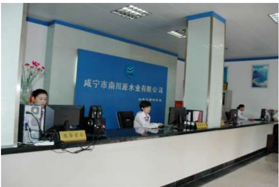
文明洁净的温泉客服中心