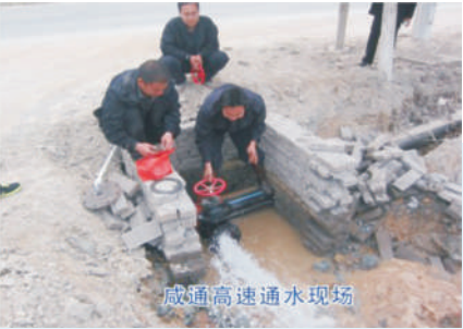
咸通高速通水现场