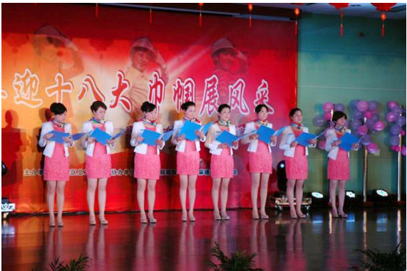
南川源之歌工装展示