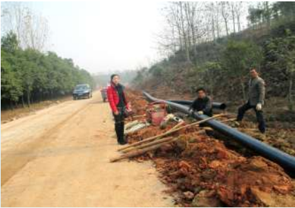
杨下供水施工现场