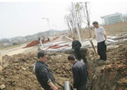
旅游集散中心施工现场