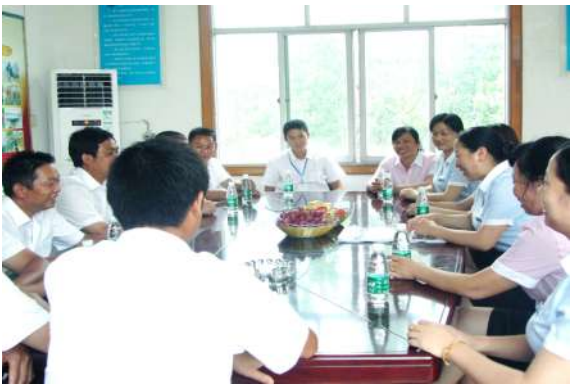
公司制水部员工讨论场景