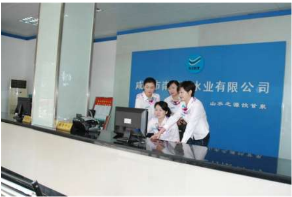
公司员工学习场景

服务为先，秉各项承诺，科学发展创和谐社会；民生为本，送一股甘泉，远景规划建美好未来