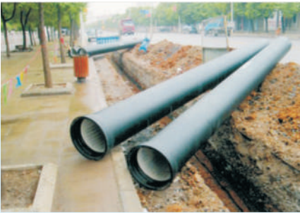
马柏大道施工现场