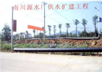
东外环供水施工现场