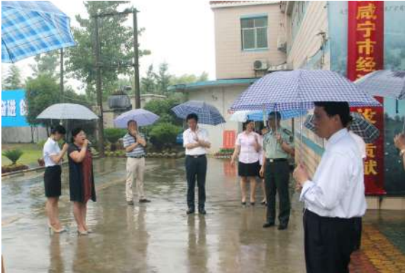
市领导视察南川源场景