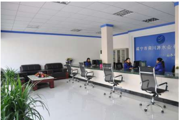
文明洁净的龙潭客服中心