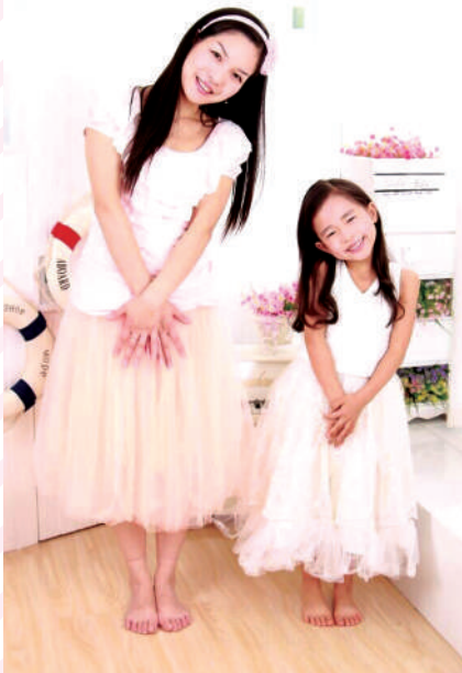
“大小公主”(韵希5岁时所拍)