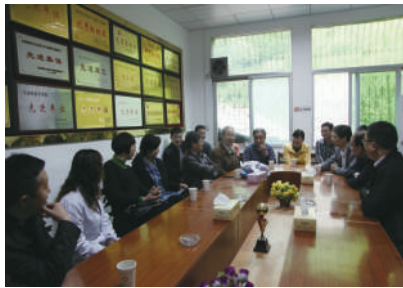
两家医院专家交流会现场