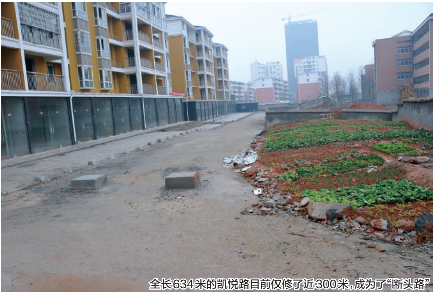
全长634米的凯悦路目前仅修了近300米，成为了“断头路”

负责城建投资的市城投公司一张姓负责人表示，凯悦路是一条因为开发商开发建设才规划的道路。2010年，市城投公司拿到这条道路的投资计划。2011年年初，这条道路的