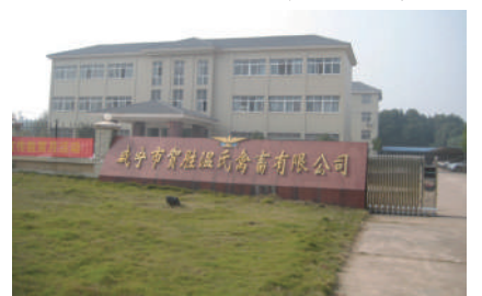
农业企业 规模宏大