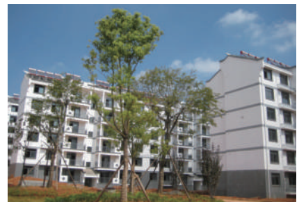
新建楼房 风格独特