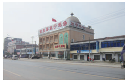
美食街道 鸡汤飘香