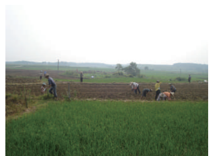
农业生产 热火朝天