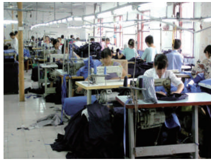
制衣企业 一片繁忙