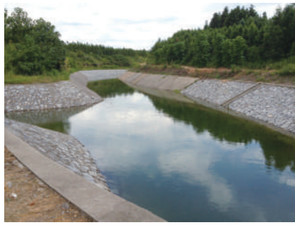
灌溉水渠 建设完好