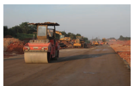
新城道路 正在施工