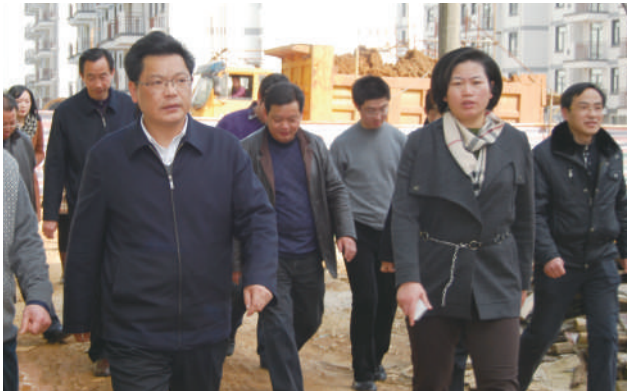
市区领导 调研指导