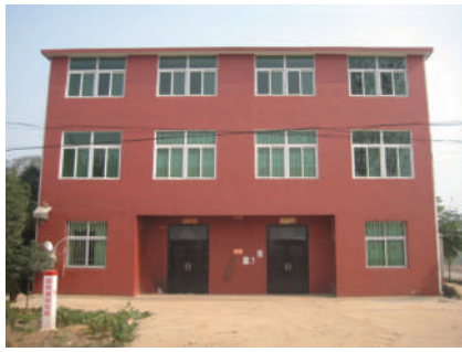
村民住房 新颖别致