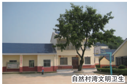
自然村湾文明卫生