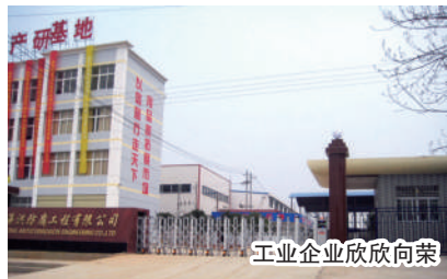
工业企业欣欣向荣

一路走来,一路观;一路采访,一路思:该镇的亮点看不完,该镇的特色描不尽。啊!横沟桥,一座呼之欲出的新型工贸大镇。