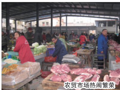
农贸市场热闹繁荣