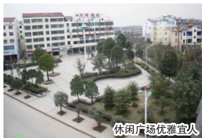
休闲广场优雅宜人