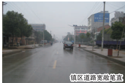
镇区道路宽敞笔直