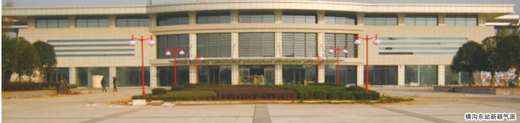
横沟桥东站新颖气派