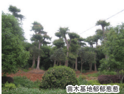
苗木基地郁郁葱葱