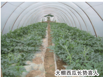
大棚西瓜长势喜人