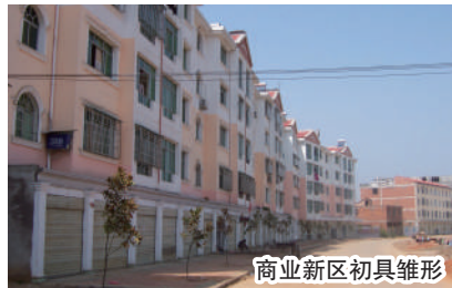
商业新区初具雏形