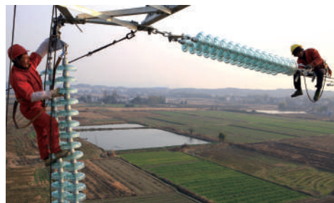
国网咸宁供电公司员工在高空架设220千伏输电线路。