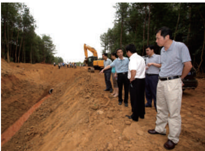
维修水渠引水抗旱