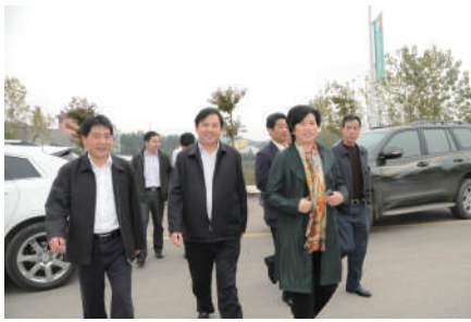
省水利厅领导亲临调研淦河工程整治情况