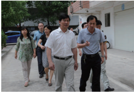
国家防办领导亲临检查抗旱队伍建设

采访结束时,记者不禁被该局党委一班人带领全体干部职工团结一心服务全区人民群众斗旱魔的精神所折服。同时,也清楚地看到该局巧借行评之机,在迎战几十年一遇的大旱时,虚功实做、开门纳谏、转变作风,纠正行风、认真履职、发挥优势,积极服务抗大旱,夺取抗旱救灾工作的最后胜利,充分传递出水利部门服务“三农”的正能量。