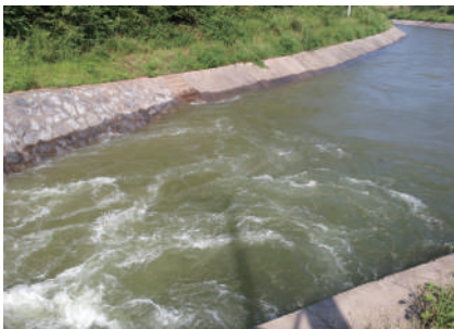
水库塘堰引水抗旱