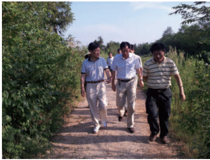
省防指抗旱工作指导组亲临指导抗旱救灾