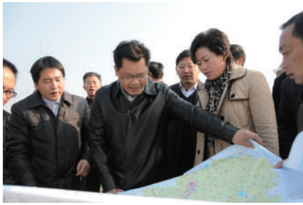
市委书记任振鹤了解淦河下游规划建设情况